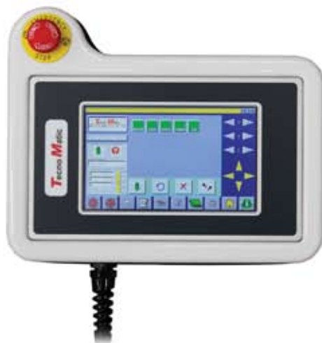
REMOTE PROGRAMMABLE KEYPAD